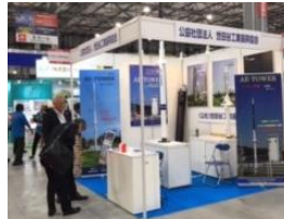
当日、展示ブースの様子