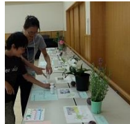
ラクトン化学工業(株)・(株)ユー花園提供「香り当てクイズ」