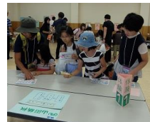
(株)山田精機提供重量当てクイズ