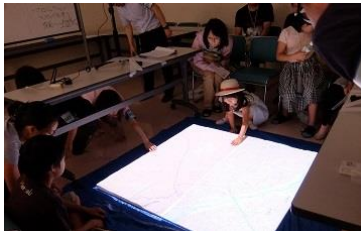
世田谷区玉川総合支所街づくり課によるプロジェクトマップによるプロジェクトマップ。桜新町の地形を見てさわって体験!