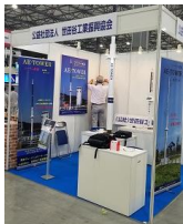
前日の丁寧な 設置風景

「危機管理産業展 2019」が盛況のうちに閉幕しました。(10月2~4日の3日で開催され来場者総数は18,486人)