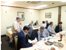
熱戦のあとは和やかに会食・表彰式が執り行われました。