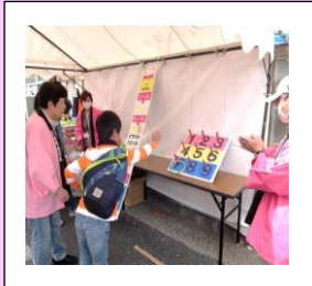
◎パーフェクトをめざして◎

また、こちらも定番の理事の皆様による「ソースせんべい」も好評で、二つの昔懐かしいコーナーで子どもからご老人まで多くの方々が楽しまれていました。