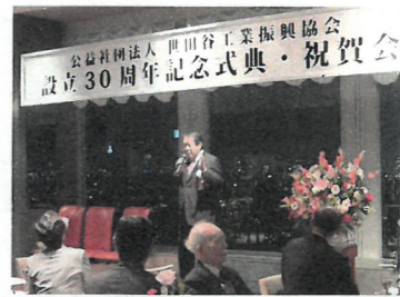
飯野副会長より中締めの挨拶