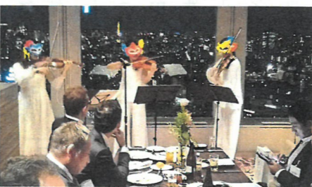
不思議系ハイオリントリオ 島金鳥の演奏