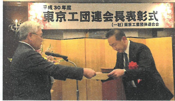
受賞された早川理事