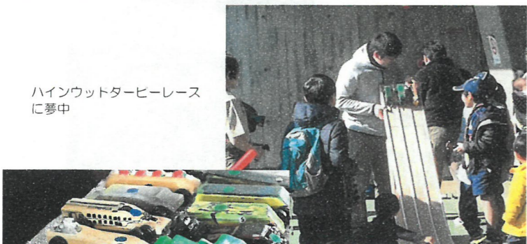
ハインウッドダービーレース に夢中