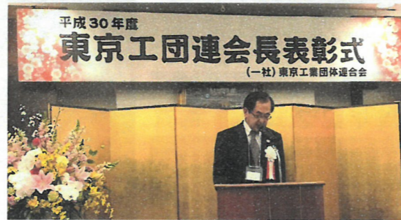
祝辞を述べる片平会長