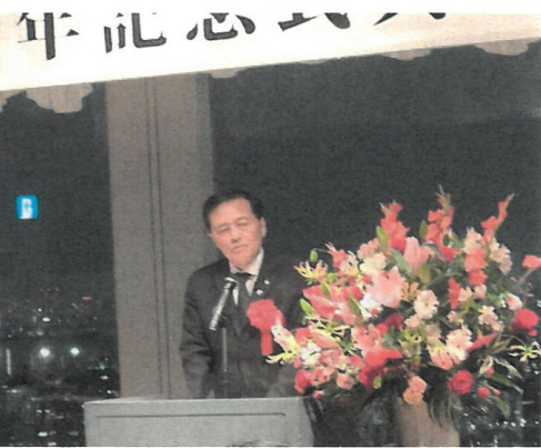
保坂区長よりご祝辞