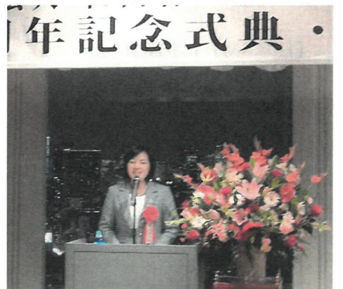
三井区議会議長よりご祝辞