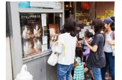
(世田谷線つまみぐい ウォーキング)