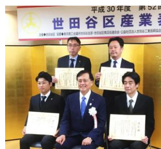
(前列左(株)エス、ディー、ケイの坂口社長)